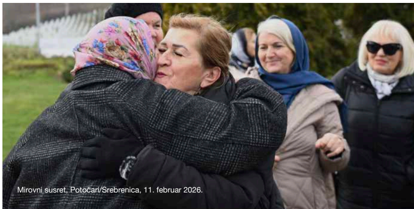
Mirovni susret, Potočari/Srebrenica, 11. februar 2026.