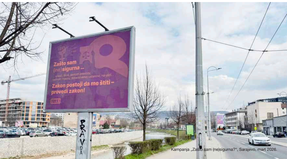
Kampanja „Zašto sam (ne)sigurna?“, Sarajevo, mart 2026.

Zahtijevamo odgovornost institucija i društvo u kojem će sigurnost žena konačno biti shvaćena kao osnovno ljudsko pravo, a ne privilegija.