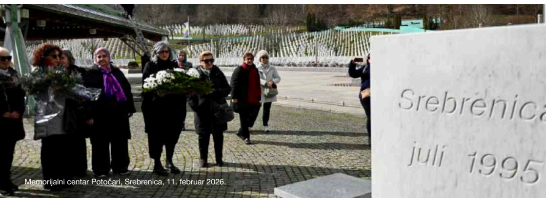
Memorijalni centar Potočari, Srebrenica, 11. februar 2026.

Od 13. do 15. marta u Sarajevu, predstavnica Fondacije CURE je, na poziv Udruženja Romska djevojka – Romani Čej iz Prnjavora, učestvovala na seminaru „Zajedno učimo, zajedno gradimo mir“. Tokom seminara govorila je o izgradnji mira i pomirenju te podršci ženama, s posebnim fokusom na marginalizirane žene, Romkinje i povratnice.