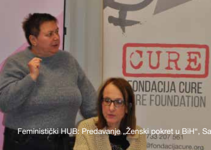
Feministički HUB: Predavanje „Ženski pokret u BiH“, Sarajevo, 26. februar 2026.