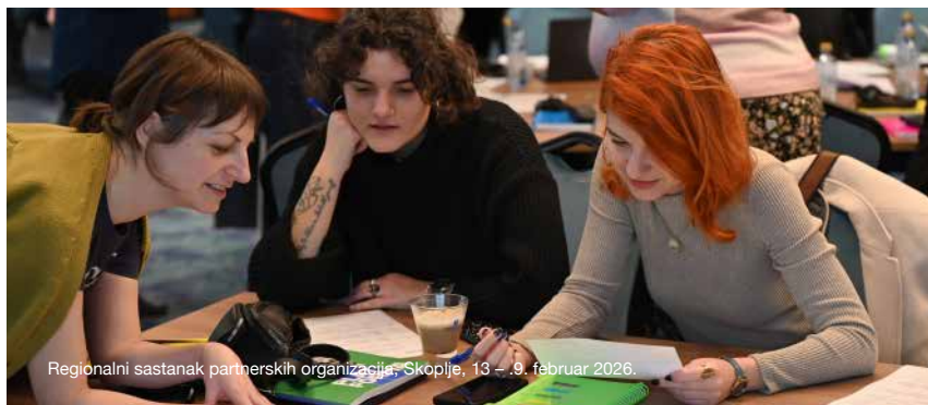
Regionalni sastanak partnerskih organizacija, Skoplje, 13 – .9. februar 2026.

Susret je zaključen definisanjem zajedničkih regionalnih prioriteta: borbe protiv nasilja nad ženama, zaštite braniteljica ljudskih prava, suprotstavljanja antidemokratskim narativima i jačanja podrške feminističkom civilnom društvu.