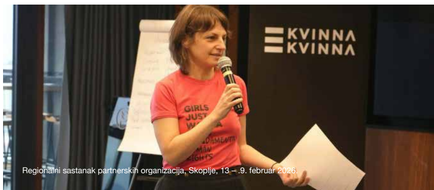
Regionalni sastanak partnerskih organizacija, Skoplje, 13 – .9. februar 2026.