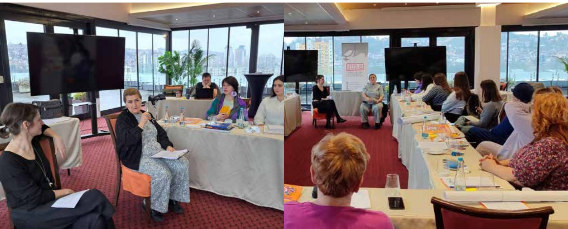
Radionica za aktivistkinje i braniteljice ženskih i ljudskih prava LGBT*IQ osoba, Sarajevo, 5. – 8. februar 2026.

Poseban dio radionice bio je posvećen simulaciji online kampanje, tokom koje su učesnice razvijale vještine komunikacije i odgovaranja na provokativna pitanja, s ciljem jačanja otpornosti i sigurnijeg djelovanja u digitalnom prostoru.