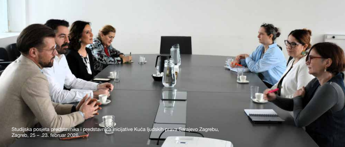
Studijska posjeta predstavnika i predstavnica Inicijative Kuća ljudskih prava Sarajevo Zagrebu, Zagreb, 25 – 23. februar 2026.