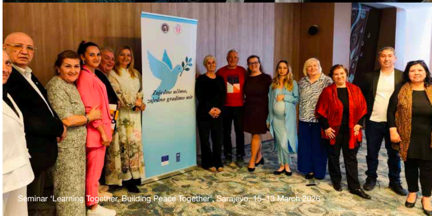
Seminar 'Learning Together, Building Peace Together', Sarajevo, 15-13 March 2026