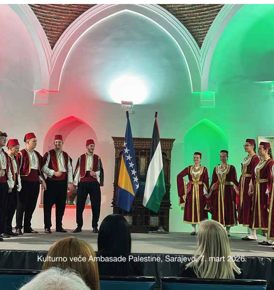
Kulturno večer Ambasade Palestine, Sarajevo, 7. mart 2026.

Ambasadorica je održala inspirativan govor o ženama koje teret rata često nose u većoj mjeri nego muškarci, naglašavajući da Međunarodni dan žena nije samo prilika za obilježavanje, već i za priznanje, poštovanje i afirmaciju uloge žena u društvu.