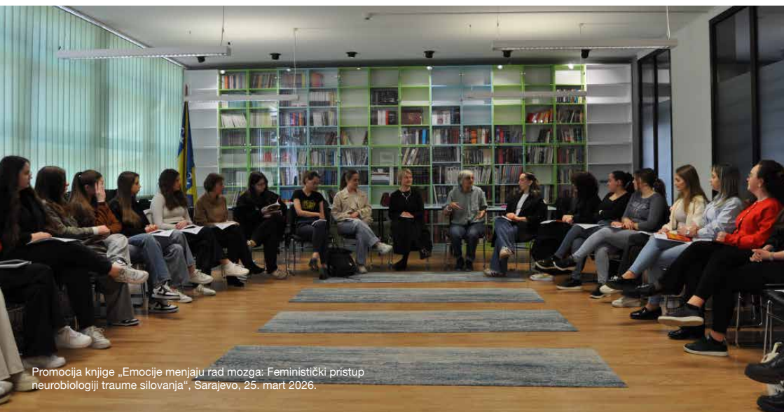
Promocija knjige „Emocije menjaju rad mozga: Feministički pristup neurobiologiji traume silovanja“, Sarajevo, 25. mart 2026.

Kako bi skrenula pažnju na značaj rodne perspektive u ustavnim i zakonskim reformama, Inicijativa je 11. marta 2026. godine uputila dopis Radnoj grupi Vijeća ministara BiH, tražeći uvođenje rodno osjetljivog jezika te ističući njegovu važnost za vidljivost žena i ostvarivanje stvarne ravnopravnosti.