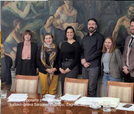
Studijska posjeta predstavnika i predstavnica Inicijative Kuća ljudskih prava Sarajevo Zagrebu, Zagreb, 25 – 23. februar 2026.