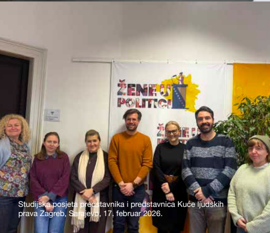
Studijska posjeta predstavnika i predstavnica Kuće ljudskih prava Zagreb, Sarajevo, 17. februar 2026.