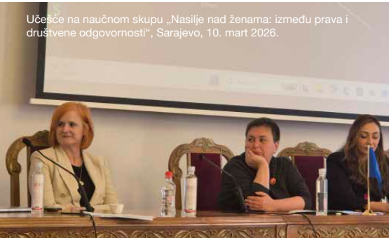
Učesce na naučnom skupu „Nasilje nad ženama: između prava i društvene odgovornosti“, Sarajevo, 10. mart 2026.