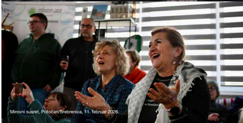
Mirovni susret, Potočari/Srebrenica, 11. februar 2026.