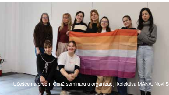
Učešće na prvom Gen2 seminaru u organizaciji kolektiva MANA, Novi Sad, 26. – 20. januar 2026.

Kroz razmjenu iskustava, znanja i dobrih praksi, ovaj susret još jednom je potvrdio koliko su solidarnost i zajedničko učenje važni za stvaranje sigurnijih i pravednijih prostora za sve. Ovakvi susreti dodatno nas motivišu da i u 2026. godini nastavimo graditi snažna savezništva i pomjerati granice inkluzivnog i odgovornog rada u regionu.