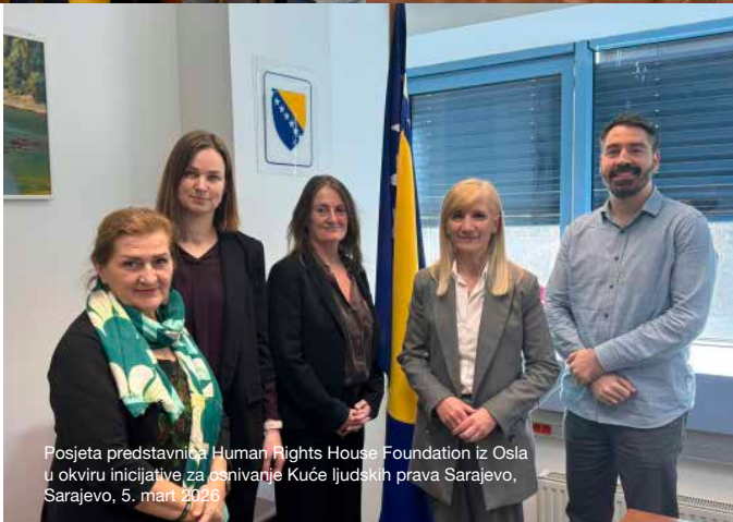
Posjeta predstavnica Human Rights House Foundation iz Osla u okviru inicijative za osnivanje Kuće ljudskih prava Sarajevo, Sarajevo, 5. mart 2026.