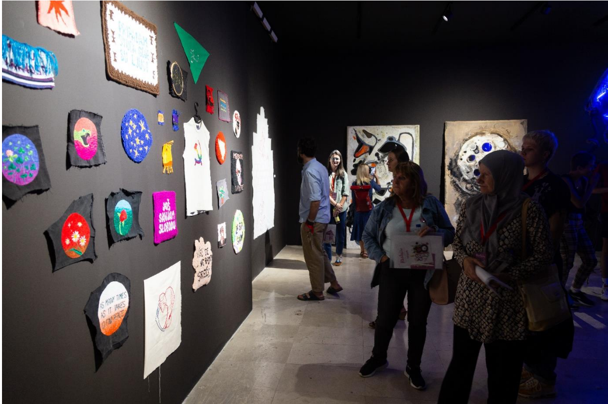
Fotografija Almiere Mehić

Kroz Ars Feminae propituje se odnos tradicije i slobode po dva principa. Prvi je princip inkluzije, oslanjanja na tradiciju kroz korištenje tradicionalnih medija i tehnika u koje se, potom, interveniše različitim mehanizmima osavremenjavanja. Drugi princip je inverzija: podrazumijeva odbijanje djelovanja u ustaljenim društvenim normama likovnog jezika. Ovakav princip podrazumijeva interveniranje u postupke i poslove koje je patrijarhat prisvojio i etiketirao „muškim“, težeći dekonstrukciji mitova i zabluda o rodnim ulogama/poslovima/zanatima/znanjima. Ova izložba pokazuje kako su tanane društvene granice i ruši zablude o muškim i ženskim poslovima.