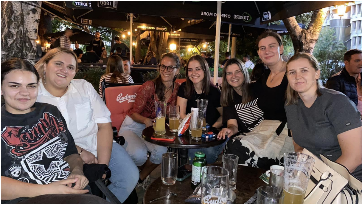
Fotografija volonterki Fondacije CURE

Benjamin: „Ovo je prva godina u kojoj sam bio volonter i moji utisci su pozitivni. Organizacija je bila na vrhunskom nivou, a tome su u velikoj mjeri svoj doprinos dali i volonteri/ke. Vrhunac festivala je definitivno bio panel o rodno zasnovanom nasilju gdje smo pričali o ovom ozbiljnom problemu sa kojim se susrećemo u našem društvu. Moj lični favorit je bila predstava Djevojčice gdje je na zabavan, ali edukativan način ispričana priča o odrastanju jedne djevojčice odnosno na šaljiv način su prikazane brojne situacije sa kojima se žene susreću u svom svakodnevnom životu. Iskreno se nadam da sam svojim primjerom podstakao druge muškarce da se u budućnosti više aktiviraju i da ćemo u budućnosti imati više muških volontera.“