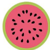
Ženska mreža BiH

Mreža za izgradnju mira - Aktivistkinja Fondacije CURE je u koordinacionom odboru Mreže za izgradnju mira u 2015. Godini. Tokom 2015. godine sproveli/e smo par zajedničkih aktivnosti koje se vežu za Sedmicu izgradnje mira, Međunarodni dana žena i aktivnosti tokom Međunarodnog dana ljudskih prava, kao i aktivnosti koje se tiču dodjele novinarske nagrade za profesionalno medijsko izvještavanje „Srđan Aleksić“.