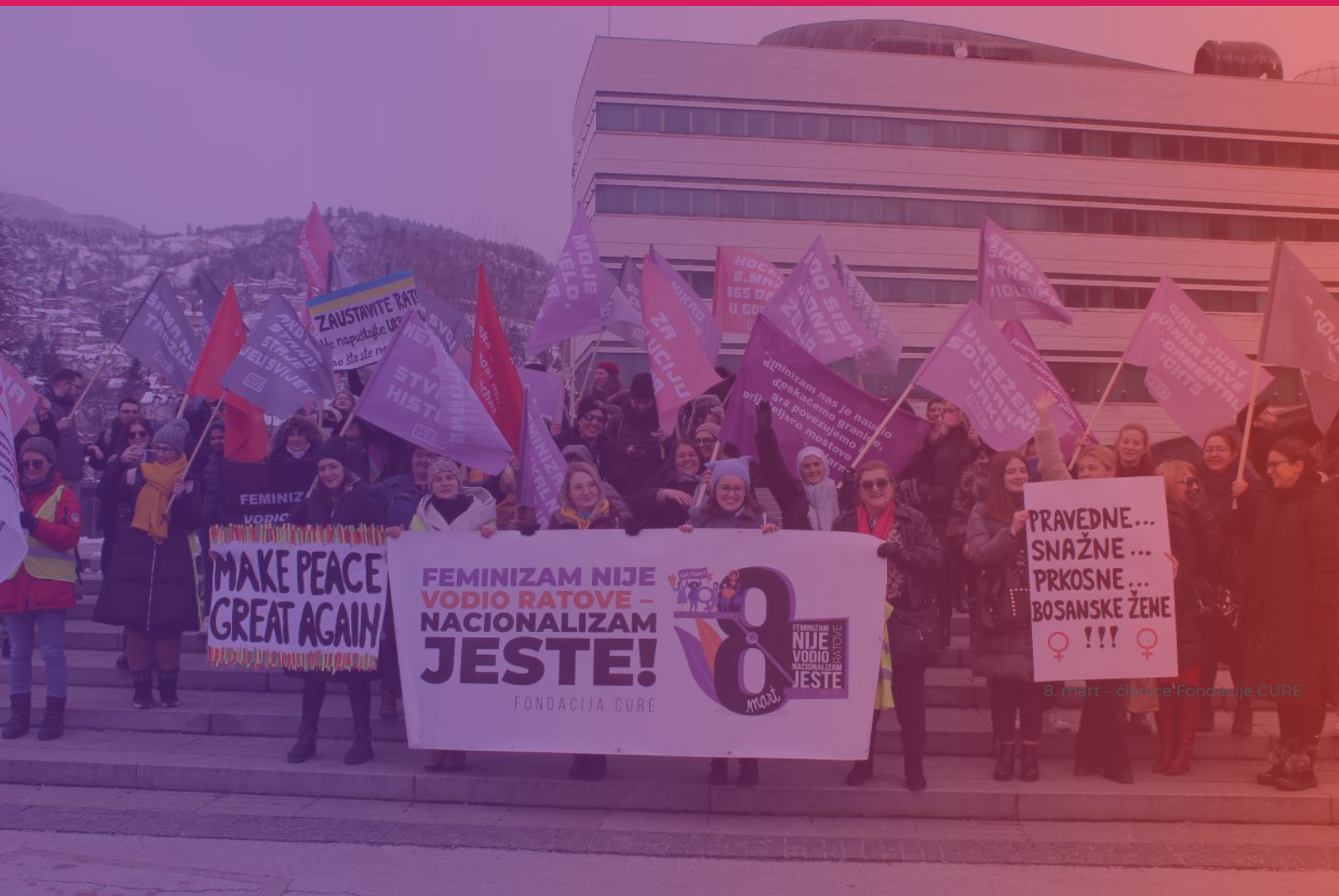
8. mart – članice Fondacije CURE

Osmomartovsko stajanje – Fondacija CURE organizirala je osmomartovski marš povodom obilježavanja 8. marta – Međunarodnog dana žena u cilju da skrene pažnju da ni u vrijeme „mira“, u vrijeme bez prirodnih katastrofa i