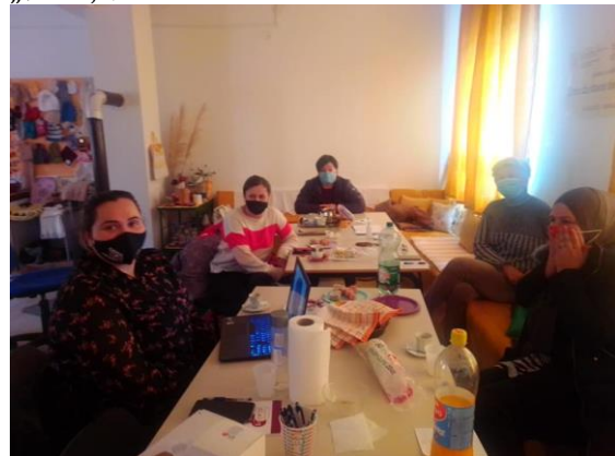
24.03.2021. godine - članice Udruženja žena „Srce i duša“ Prokosovići/Lukavac