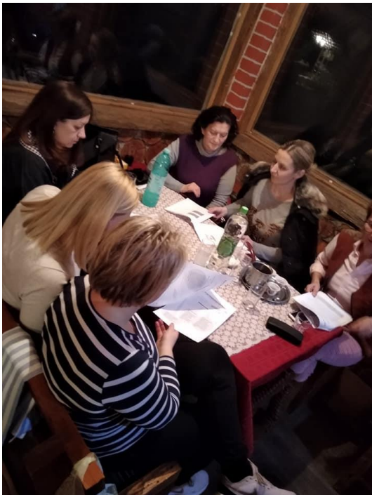
23.02.2021. godine - članice Udruženje žena NERA, Konjic

U sklopu ove inicijative do kraja marta organizovane su i jednodnevne radionice za ženske organizacije koje Fondacija za osnaživanje žena podržava kroz agendu „Život da stane ne smije“ i to u Konjicu, Mostaru, Zavidovićima, Lukavcu (Prokosovići) i Visokom.