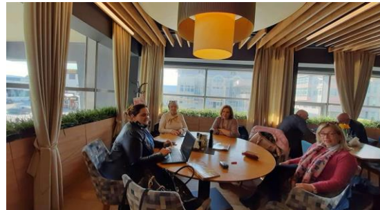
19 i 20. 03.2021. godine - članice Dnevnog centra za socijalnu skrb „Kuća otvorenog srca“ i Udruženja žena „VRBA“, Mostar