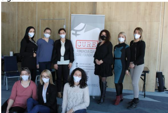
Učesnice radionice „Integrisane sigurnosti za žene“

Organizovale smo radionicu „Integrisane sigurnosti za žene“ na kojoj su prisustvovala članice Mreže policijskih službenica. Jako smo sretne što smo uspjele stvoriti prostor za determiniranje organizacijskih i ličnih snaga neophodnih u razvijanju koncepta integrisane sigurnosti.