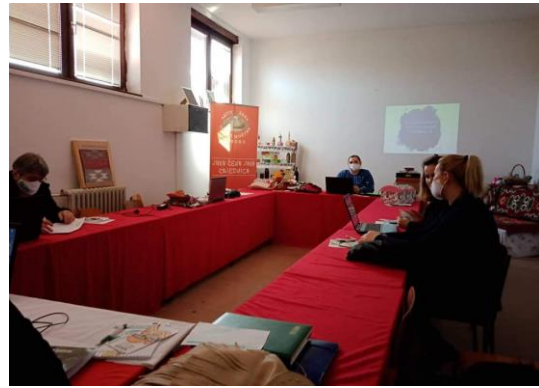
25.02.2021. godine - članice „Aktiva žena Donje Moštre“, Visoko